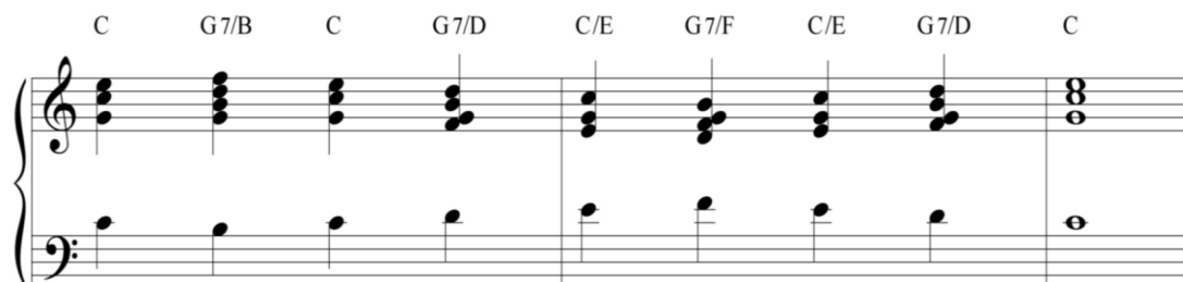
Imagen 1: Ejemplo de cifrado americano