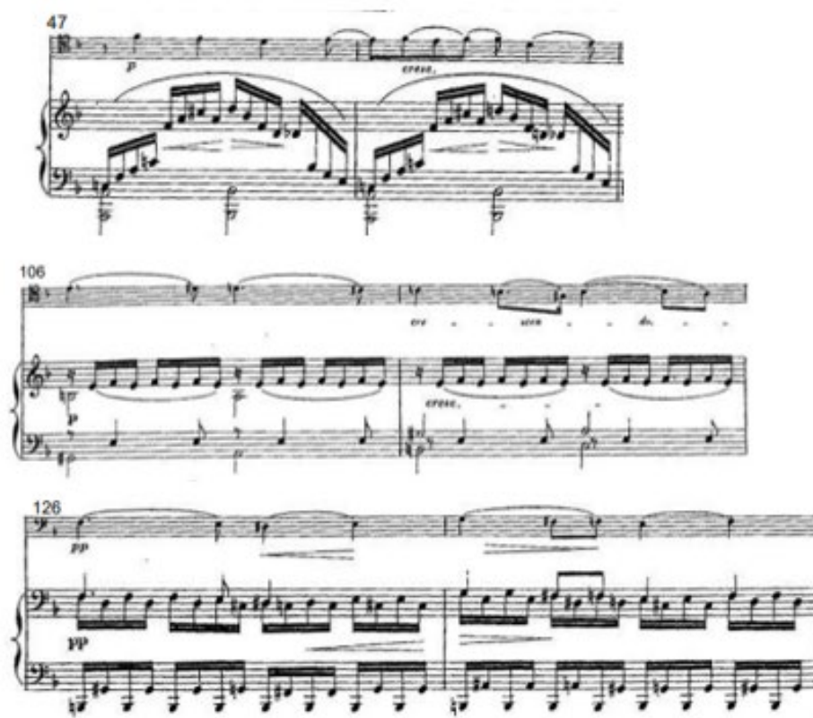
Figura 5: Extractos de A2 (Mov. I, c 47-48), D1 (Mov. I, c. 106-107) y D2 (Mov. I, c 126-127)

Nota: Sonate Dramatique: Titus et Bérénice de Rita Strohl (París: Enoch, 1898).