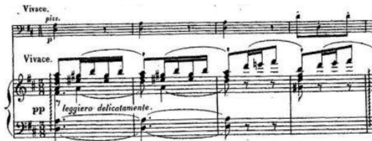
Figura 3: Introducción del segundo movimiento (Mov. II, c. 1 – 4)

Nota: Sonate Dramatique: Titus et Bérénice de Rita Strohl (París: Enoch, 1898).