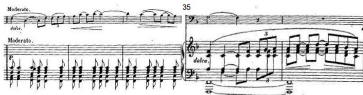
Figura 1: Tema de la Esperanza (Mov. I, c. 32 – 36)

Nota: Sonate Dramatique: Titus et Bérénice de Rita Strohl (París: Enoch, 1898).