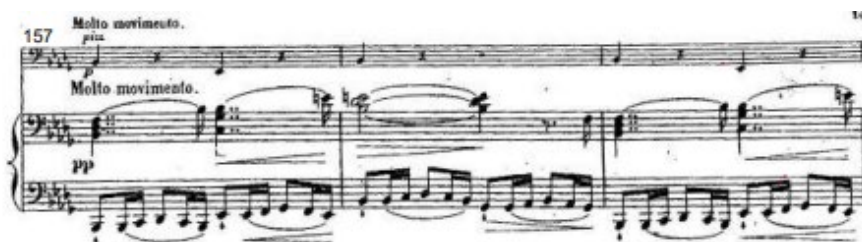
Figura 6: Extracto de D3 (Mov. I, c. 157 - 162)