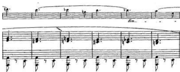
Figura 7: Acordes en paralelo sin función tonal (Mov. II, c. 144-148)

Nota: Sonate Dramatique: Titus et Bérénice de Rita Strohl (París: Enoch, 1898).