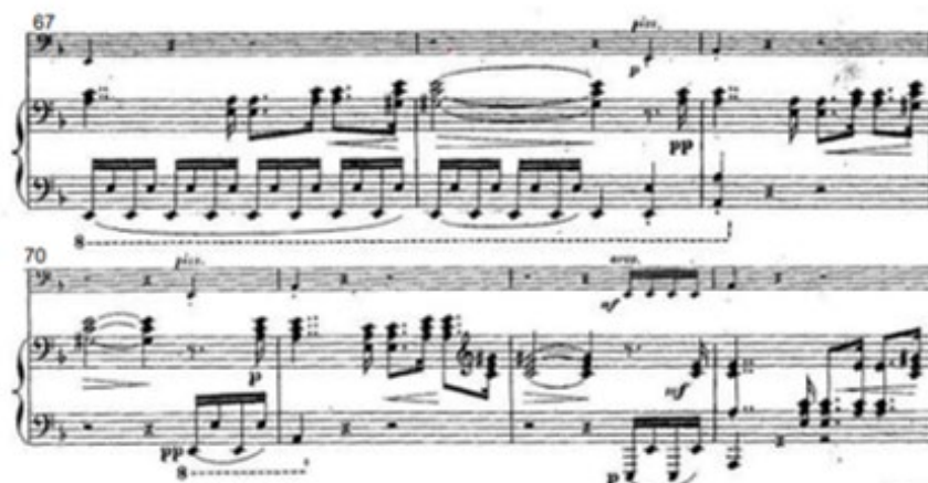
Figura 2: Tema de la Incertidumbre (Mov. I, c. 67 – 75)

Nota: Sonate Dramatique: Titus et Bérénice de Rita Strohl (París: Enoch, 1898).