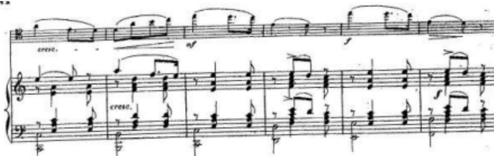
Figura 8: Fragmento de A2 (Mov. III, c. 25 - 36)

Nota: Sonate Dramatique: Titus et Bérénice de Rita Strohl (París: Enoch, 1898).