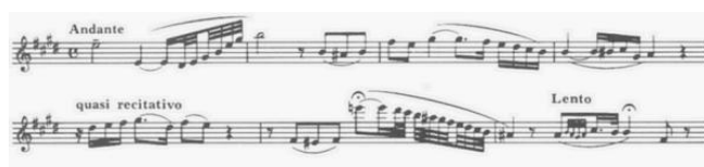
Ejemplo musical 1: Thomas, A., Hamlet , solo de saxofón alto en mib. ©1868 por Ed. Heugel.

El uso del saxofón alto en esta ópera constituyó una novedad absoluta, siendo la primera composición del siglo XIX que utilizó este instrumento de forma significativa. En el siguiente ejemplo puede observarse uno de los solos del saxofón. Es una melodía tranquila, de articulación suave y explota mucho más el registro medio/agudo que el grave.