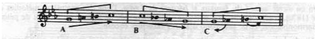
Imagen 1. Direccionalidades melódicas en el tetracordo final en el modo menor (Chailley, 1985, pág. 147).

Nuestra escala menor clásica es a menudo muy mal explicada en los manuales al uso. Se compone de un pentacordo fijo apoyado sobre la quinta I-V [...] y de un tetracordo móvil donde los grados interiores VI y VII sufren atracciones contradictorias; de ahí su forma elevada en la melódica ascendente (A), rebajada en la melódica descendente (B) y divergente en función armónica (C): 2